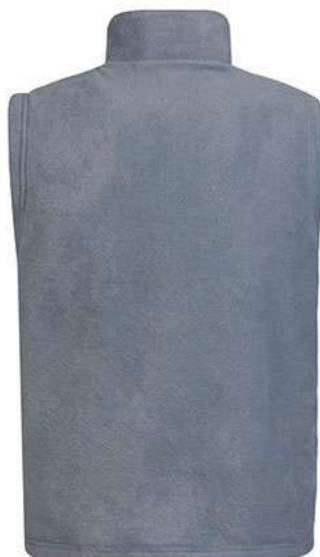
Vista capa tejido polar