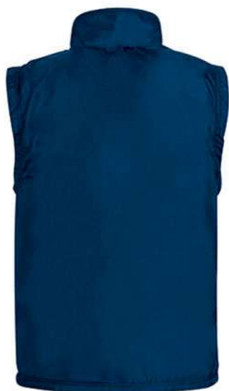
Vista capa tejido hidrofugado