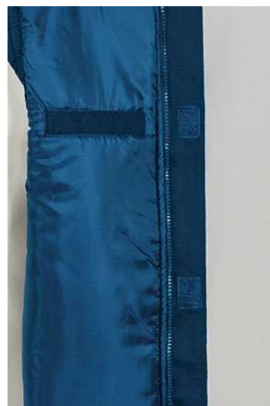
Detalle bolsillo interior en pecho izquierdo