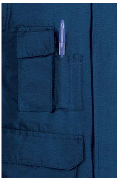
Detalle bolsillo en pecho derecho